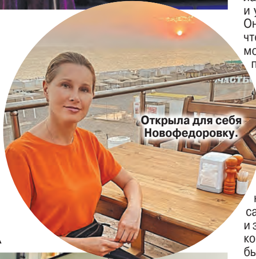
Открыла для себя Новофедоровку.